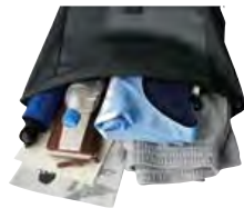
ロールトップ部分を開いた状態