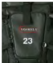
ロゴ・個人名・番号の加工例