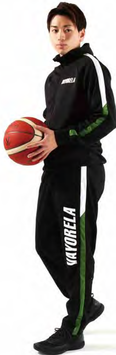
身長：177cm ジャケット：LL / パンツ：LL