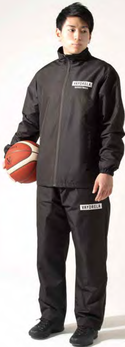
身長: 177cm ジャケット: LL / パンツ: LL