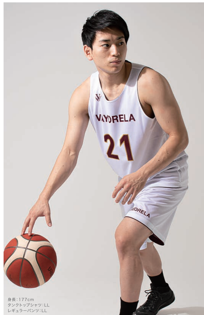
身長:177cm タンクトップシャツ:LL レギュラーパンツ:LL