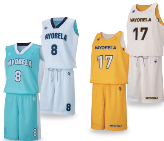
TYPE-2 レディースシャツ 表:ターコイズ/ホワイト 裏:ホワイト