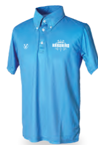
ボタンダウンポロシャツ ボタンカラーは、右ページと共通