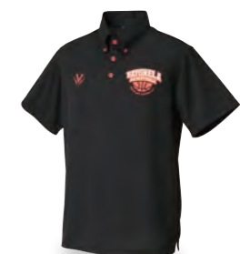
ボタンダウンポロシャツ