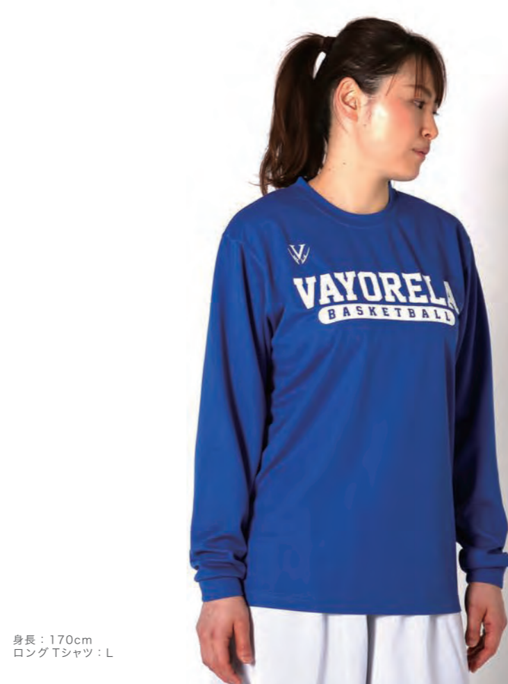
身長：170cm ロングTシャツ：L