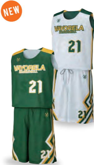
NEW レディースシャツ RECS-038 表:①グリーン②イエロー③ホワイト 裏:①ホワイト②グリーン③イエロー