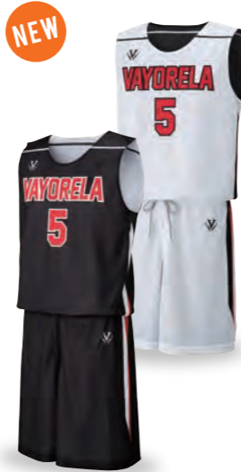
NEW カットスリーブシャツ RECS-037 表:①ブラック②ホワイト③レッド 裏:①ホワイト②ブラック③レッド