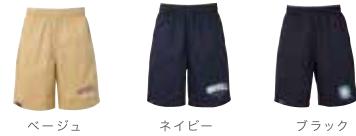
ベージュ ネイビー ブラック